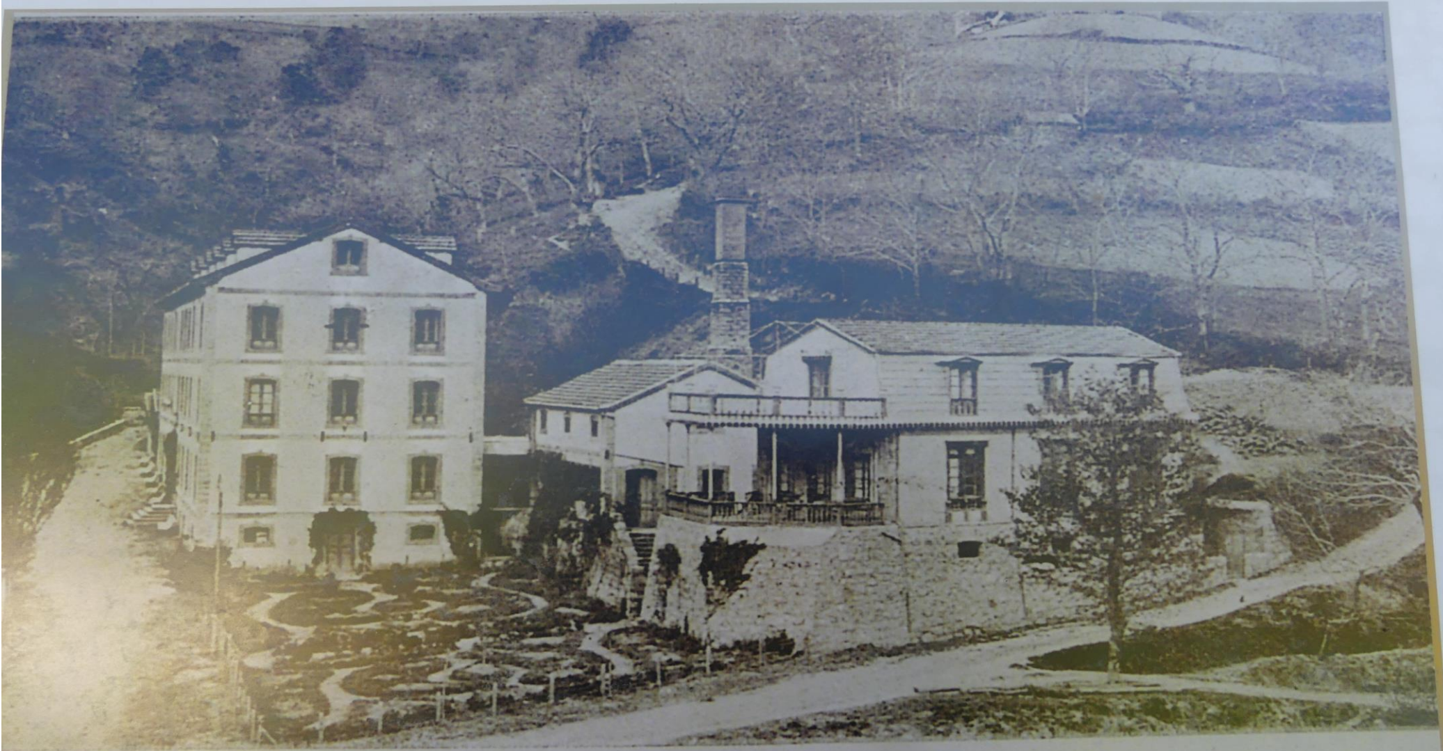
BALNEARIO DE BORINES (ASTURIAS).—Vista general del Balneario